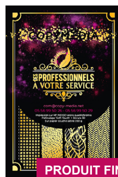
PRODUIT FINI AVEC FOIL*

*FOIL : feuille de métal (dorure, argenté, cuivré, bleu métallique, holographique, mat, brillant, etc)